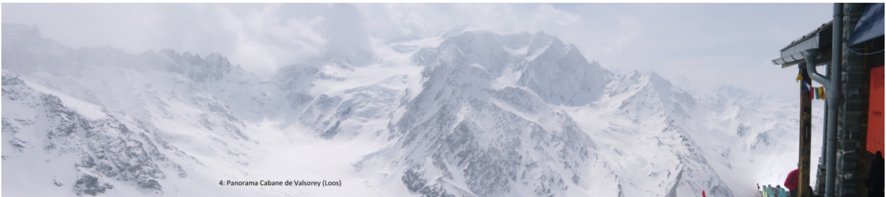
Bild Nr. 4 gibt hoffentlich das großartige Panorama wieder, das sich von der Cabane de Valsorey aus in Richtung Mont Vélan entfaltet. Der Aufstieg zur 3.037m hoch gelegenen Hütte durch das landschaftlich prächt-

tige Valsorey war das Pensum der zweiten Etappe. Die Hütte ist klein und gemütlich, wenigstens dann, wenn man sich von engen Lagern und von im Gastraum ausdünstenden Innenschuhen auf Kopfhöhe nicht weiter irritieren lässt. Schon im Aufstieg zur, aber auch auf der Hütte selbst riskiert man immer mal wieder einen Blick oder Gedanken hinauf zum majestätischen Grand Combin, an dem man anderntags über das Plateau du Couloir vorbeizukommen hofft.