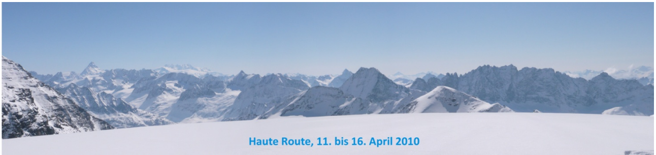
Haute Route, 11. bis 16. April 2010