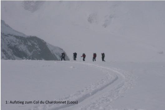
1: Aufstieg zum Col du Chardonnet (Loos)

Bild Nr. 1 zeigt einen Teil unserer Gruppe beim allerersten Aufstieg der Tour vom Glacier d'Argentière in