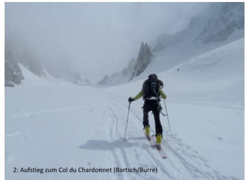
2: Aufstieg zum Col du Chardonnet