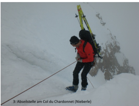
3: Abseilstelle am Col du Chardonnet