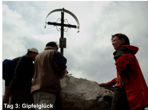
Tag 3: Gipfelglück

Bei der Morgentoilette um sechs Uhr regnet es tatsächlich. Doch wie heißt es so schön: Nach dem Frühstück sieht die Welt ganz anders aus. Und tatsächlich, zwei Scheiben Brot und zwei Tassen Kaffee später, pünktlich zu unserem Aufbruch, hört es auf zu regnen.