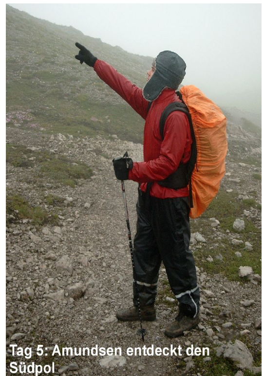
Tag 5: Amundsen entdeckt den Südpol

Schließlich mündet der Theodor-Haas-Weg im Aufstieg zum Hinterseejochl (2.482 m). Hier treibt der Wind uns den Schnee abwechselnd von der Seite und von vorn ins Gesicht, aber der steile Aufstieg macht Spaß. Vor uns wechseln dutzende Gamsen über ein Schneefeld, nachdem sie uns wahr genommen haben. Ein faszinierendes Schauspiel, diesen so perfekt ans Hochgebirge angepassten Tieren unter diesen Umständen zuzusehen. Mit Leichtigkeit überwinden sie 50, 100, 200 Meter Fels und Geröll in Sekundenschnelle. Bei uns geht der Aufstieg nicht so schnell, doch die Erwartung, danach zur Mittagspause im Kaiserjochhaus absteigen zu können, treibt uns an. Was wir bergauf nicht wissen: Nach dem Anstieg warten noch einige schwierige, zum Teil ungesicherte Passagen auf uns. Die Nässe, inzwischen wieder Regen, beginnt wieder an meinen Nerven zu zerren. Heute ärgere ich mich nicht über meine Schuhe, heute rege ich mich über meine zu lange Regenhose auf, die ständig über die Hacken rutscht und die ich jedes Mal wieder hoch ziehen muss.