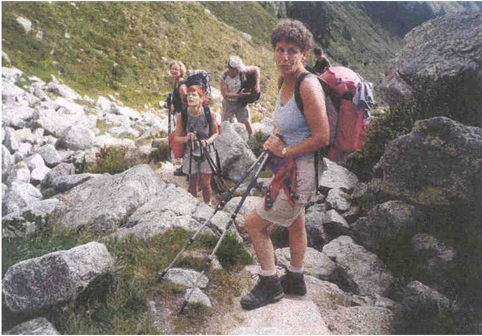
Aufstieg zum Fenetre d'Arpette (2665m)