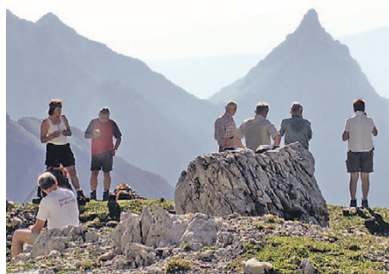
Blick auf die markante Silber Spitze.

Die Durchquerung Europas auf einem der elf verschiedenen Fernwanderwege stellt für jeden Wanderer ein ganz besonderes Erlebnis dar. In diesem Sommer bieten wir zusammen mit unserem kompetenten Partner, der Oberstdorfer Bergschule OASE AlpinCenter, die Wanderung auf dem besonders abwechslungsreichen Abschnitt des E5 von Oberstdorf an der Alpennordseite nach Meran an der Alpensüdseite bereits zum fünften Mal als Leserreise an. Die Anziehungskraft dieser Tour liegt am Wechsel und an der Gegensätzlichkeit der vielen Landschaften und Vegetationszonen, die wir durchwandern. Bunte Blumenwiesen und Grasberge in den Allgäuer Alpen, faszinierende Rundblicke auf die markanten Felszacken in den „Lechtalern“, die scheinbar endlosen Gletscher und die gewaltigen Bergriesen im Ötztal und schließlich das südliche Klima Merans, lassen diese, inzwischen schon klassische, Wanderung für alle Teilnehmer zu einem einzigartigen Erlebnis werden.