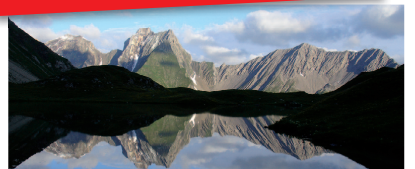
Seewiese bei der Memminger Hütte in den Lechtaler Alpen

Bereits zum fünften Mal im Programm Wanderwoche auf dem E5 vom 4. – 10. Juli 2011