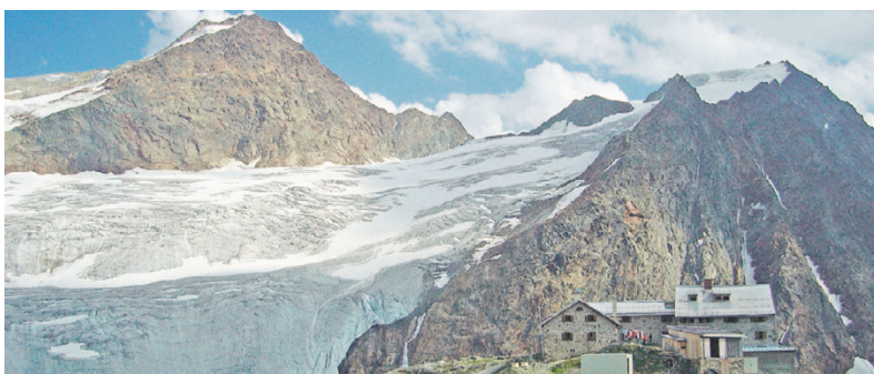
Die Braunschweiger Hütte in den Öztaler Alpen auf dem E5.

Die Durchquerung Europas auf einem der elf verschiedenen Fernwanderwege stellt für jeden Wanderer ein ganz besonderes Erlebnis dar. In diesem Sommer bieten wir zusammen mit unserem kompetenten Partner, der Oberstdorfer Bergschule OASE AlpinCenter, die Wanderung auf dem besonders abwechslungsreichen Abschnitt des E5 von Oberstdorf an der Alpennordseite nach Meran an der Alpensüdseite bereits zum fünften Mal als Leserreise an. Die Anziehungskraft dieser Tour liegt am Wechsel und an der Gegensätzlichkeit der vielen Landschaften und Vegetationszonen, die wir durchwandern. Bunte Blumenwiesen und Grasberge in den Allgäuer Alpen, faszinierende Rundblicke auf die markanten Felszacken in den „Lechtalern“, die scheinbar endlosen Gletscher und die gewaltigen Bergriesen im Ötztal und schließlich das südliche Klima Merans, lassen diese, inzwischen schon klassische, Wanderung für alle Teilnehmer zu einem einzigartigen Erlebnis werden.