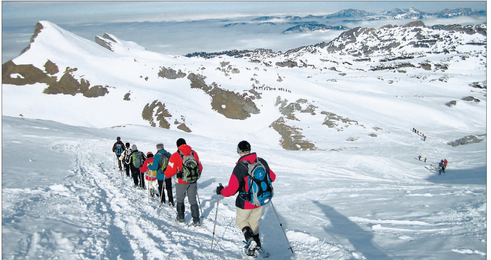
Vom Hahnenköpfe runter geht es in vier Gruppen auf das Gottesackerplateau, einer unter Naturschutz stehenden Karstlandschaft.

Kleinwalsertal – In schnellen Zeiten mag gelegentliches Innehalten Balsam sein für gehetzte Gemüter. Das kann man im Tal, und man kann es auf dem Berg. Die mittlerweile vierte Schneeschuhwanderung für Abonnenten der Eßlinger Zeitung, wieder einmal in Zusammenarbeit mit dem bewährten Kooperationspartner aus Oberstdorf, der Bergschule OASE AlpinCenter, führt diesmal ins Kleinwalsertal. Eine ideale Sache für alle, die gerne im Winter draußen sind. Schneeschuhlaufen ist nämlich leicht zu lernen. Man geht etwas breitbeiniger, findet zusätzlichen Halt mit Teleskopstöcken und trägt ein Verschüttensuchgerät bei sich. So ausgerüstet schweben 43 Frauen und Männer und vier Bergführer kurz nach 10 Uhr mit den alten Sesselliften der Ifen-Bahn von der Auenhütte über Hirschegg hoch zur Bergstation, 2026 Meter über dem Meeresspiegel. Die ersten Gehversuche führen auf das nahe gelegene Hahnenköpfe auf 2080 Meter, das schräge Plateau des Hohen Ifen im Blick. Diesmal passt das Wetter für die vorgesehene Tour über den Gottesacker, im vergangenen Jahr musste ins benachbarte Schwarzwassertal und auf die gleichnamige Alpenvereinschütte ausgewichen werden. Nun klappt es also mit der Gipfelschau vom Hahnenköpfe: Vom Diedamskopf bis zur Nagelfluhkette im Westen und Norden – im Osten über den Allgäuer Hauptkamm vom markanten Hochvogel zur Trettachspitze bis hin zu den Schafalpenköpfen über dem Wildental. Ein Vier-Sterne-Blick.