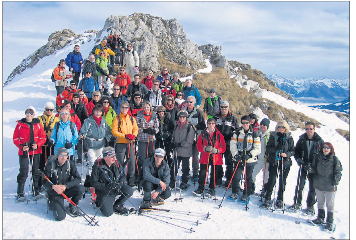
Gruppenbild auf dem Hahnenköpfe etwas oberhalb der Bergstation beim Hohen Ifen.

■ Die Bildergalerie ist zu finden unter: www.esslinger-zeitung.de/aboplus www.oase.alpin.de